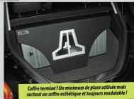
Coffre terminé ! Un minimum de place utilisée mais surtout un coffre esthétique et toujours modulable !