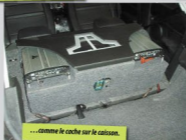
...comme le cache sur le caisson.