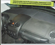
Coffre mis en place, tous les BR restent invisibles. L'implémentation se révèle parfaite car tous les points sont à leur emplacement géométriquement !